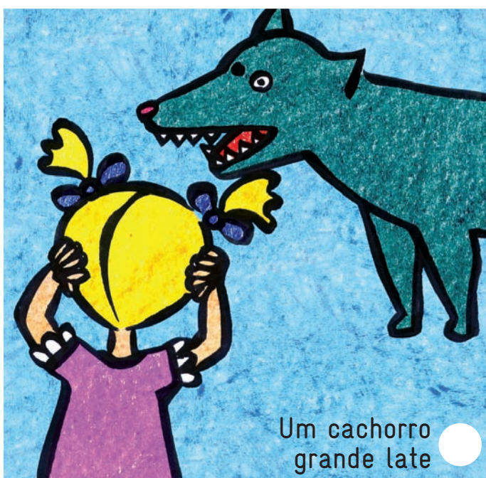
Um cachorro grande late