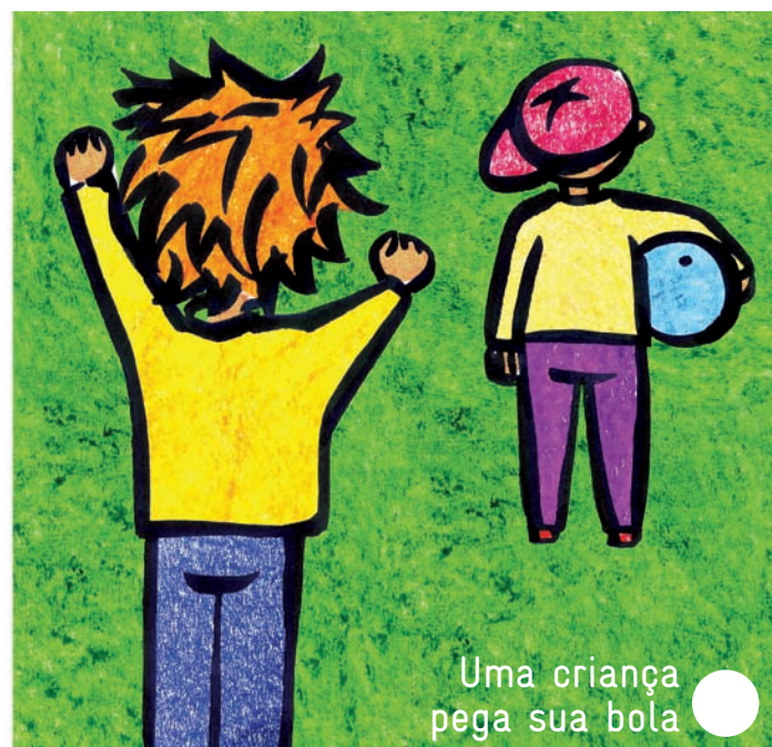
Uma criança pega sua bola