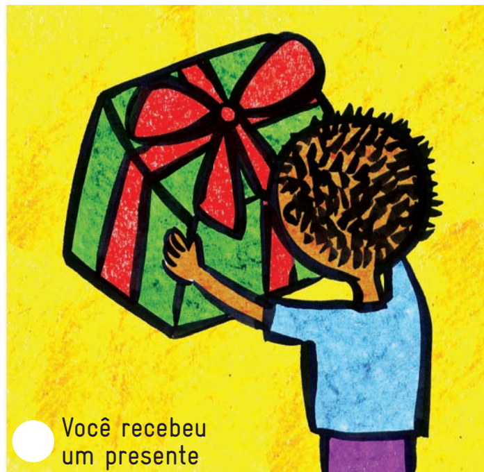
Você recebeu um presente