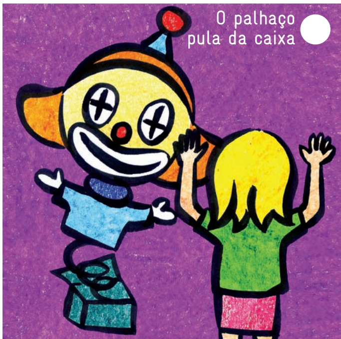
O palhaço pula da caixa